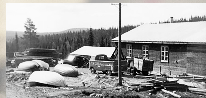
Båtbyggeriet i Hundberg.

– Men det vi försöker bevara är vårt motto att inget är omöjligt. Vi är generösa med att ta tillbaka och åtgärda produkter som gått sönder. Vi vill vara generösa när det gäller reklamationer. Här finns reservdelar till 30 år gamla Nila-pulkor som vi kan använda vid behov.